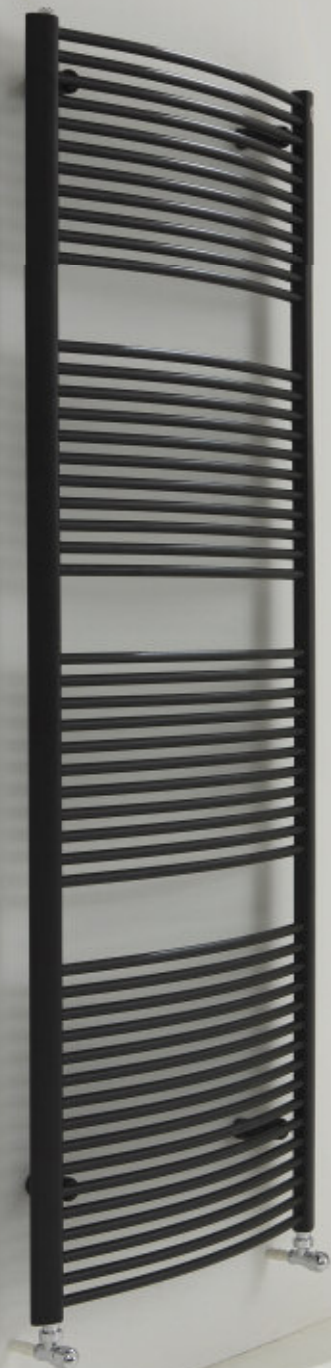
Calorifer vopsit în culoarea Negru Satinat (cod. 30)